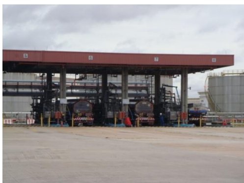
รูปที่ 3-47 สถานีสูบน้ำทางรถ