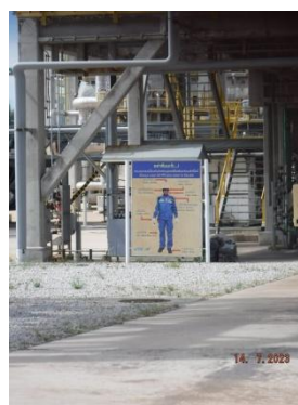
รูปที่ 3-38 ป้ายเตือนสวมใส่อุปกรณ์คุ้มครอง ความปลอดภัยส่วนบุคคล

ภาพถ่ายประกอบการปฏิบัติตามมาตรการป้องกันและแก้ไขผลกระทบสิ่งแวดล้อม (ระยะดำเนินการ) โครงการโรงกลั่นน้ำมัน บริษัท สตาร์ ปิโตรเลียม รีไฟน์นิ่ง จำกัด (มหาชน)