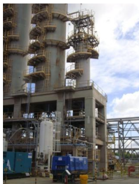
รูปที่ 3-13 DeSO x Catalyst ที่ RFCCU