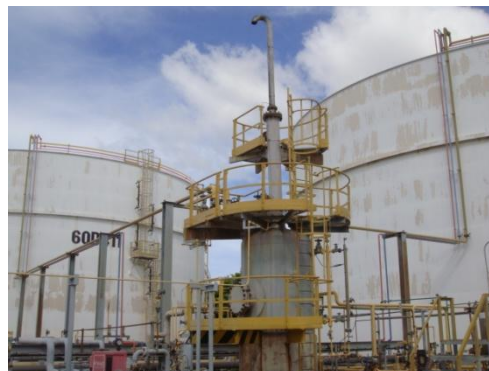
รูปที่ 3-14 Scrubber ที่ Sulfur Tank