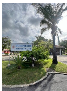
รูปที่ 3-32 สถานพยาบาล

ภาพถ่ายประกอบการปฏิบัติตามมาตรการป้องกันและแก้ไขผลกระทบสิ่งแวดล้อม (ระยะดำเนินการ) โครงการโรงกลั่นน้ำมัน บริษัท สตาร์ ปิโตรเลียม รีไฟน์นิ่ง จำกัด (มหาชน)