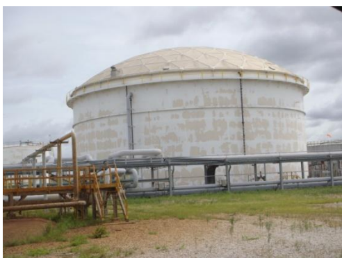
รูปที่ 3-17 ฝารอบถัง Equalization เพื่อลดกลิ่น