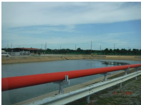
บ่อรวบรวมน้ำฝนที่มีโอกาสปนเปื้อน (Potentially Contaminated Storm Water Holding Pond)