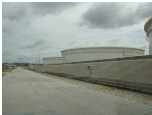
รูปที่ 3-28 คันกั้นบริเวณพื้นที่ลานถังกักเก็บ