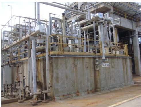
รูปที่ 3-10 ระบบตรวจอากาศจากบ่อซัลเฟอร์