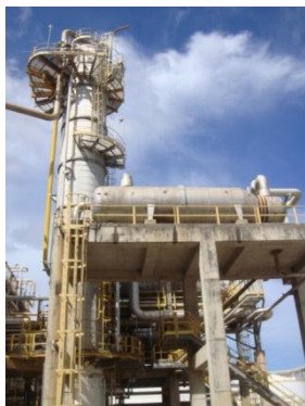
รูปที่ 3-3 Amine Regeneration Unit