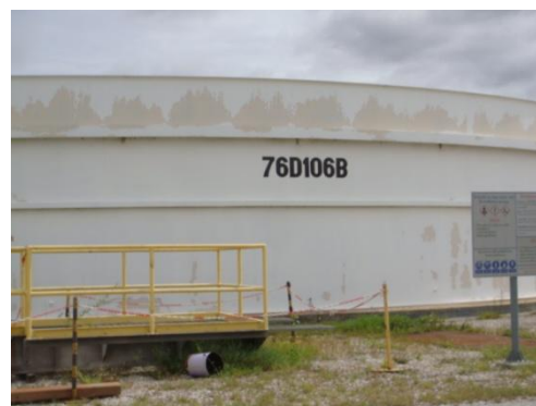
บ่อดกตะกอน (Bioreactor Clarifier)