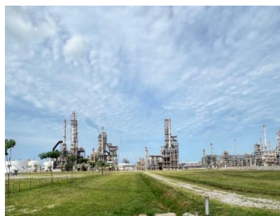
ภาพรวมของโรงกลั่นน้ำมัน