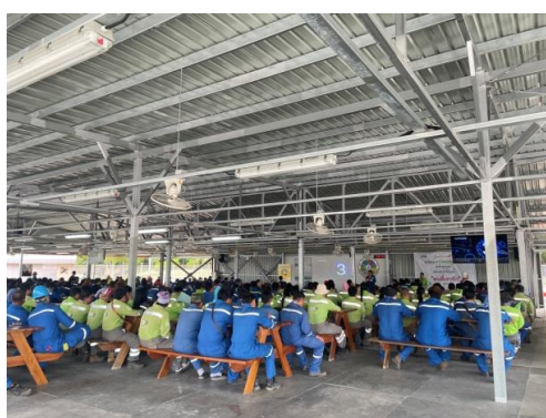
รูปที่ 3-41 การประชุมประจำวันของผู้รับเหมา