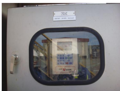
รูปที่ 3-7 Oxygen Analyzer