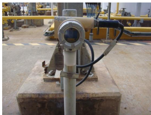
รูปที่ 3-16 H 2 S Detector