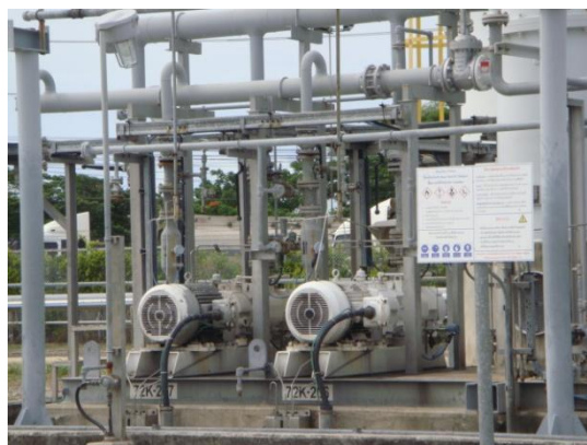
รูปที่ 3-21 Pump/Blower ของ VRU

ภาพถ่ายประกอบการปฏิบัติตามมาตรการป้องกันและแก้ไขผลกระทบสิ่งแวดล้อม (ระยะดำเนินการ) โครงการโรงกลั่นน้ำมัน บริษัท สตาร์ ปิโตรเลียม รีไฟน์นิ่ง จำกัด (มหาชน)