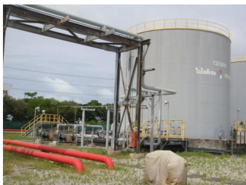
รูปที่ 3-44 คันกั้นของถัง B100