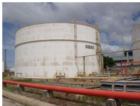
Sour Water Feed Tank