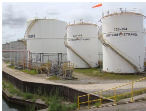
รูปที่ 3-43 ถังกักเก็บของถังเอทานอล

ภาพถ่ายประกอบการปฏิบัติตามมาตรการป้องกันและแก้ไขผลกระทบสิ่งแวดล้อม