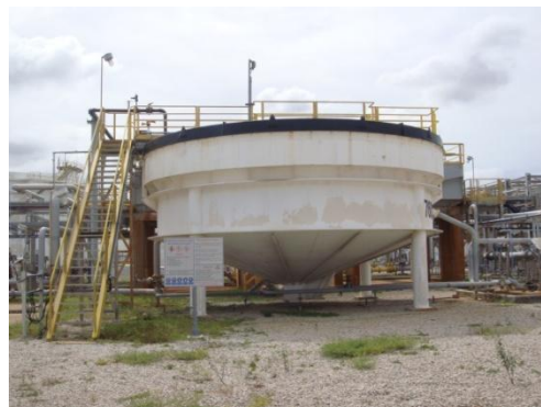
หน่วยแยกน้ำมันออกจากน้ำเสีย (API Separator Unit)