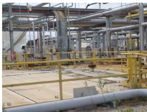
รูปที่ 3-18 ฝापิดที่ API Oil/Water Separator

ภาพถ่ายประกอบการปฏิบัติตามมาตรการป้องกันและแก้ไขผลกระทบสิ่งแวดล้อม (ระยะดำเนินการ) โครงการโรงกลั่นน้ำมัน บริษัท สตาร์ ปิโตรเลียม รีไฟน์นิ่ง จำกัด (มหาชน)