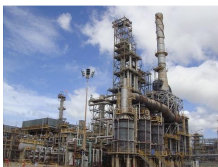
Platformer & CCR