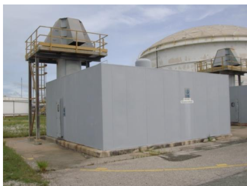
รูปที่ 3-37 Enclosure