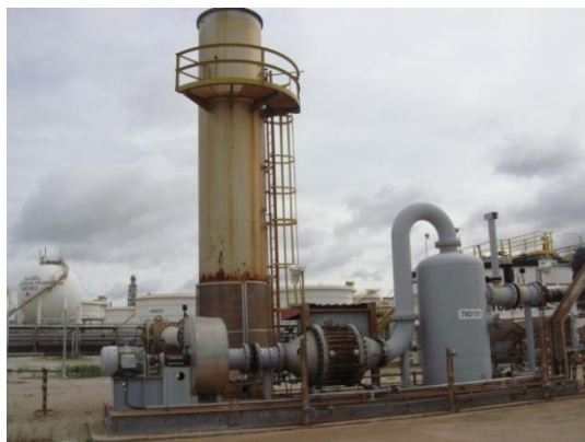
รูปที่ 3-19 ETP Ground Flare