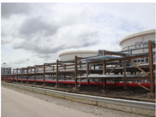
รูปที่ 3-49 Pipe Rack สำหรับท่อขนส่งน้ำมัน