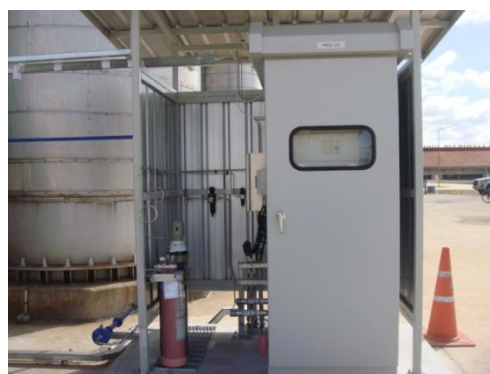
รูปที่ 3-12 CEMS ของปล่อง HRSG

ภาพถ่ายประกอบการปฏิบัติตามมาตรการป้องกันและแก้ไขผลกระทบสิ่งแวดล้อม