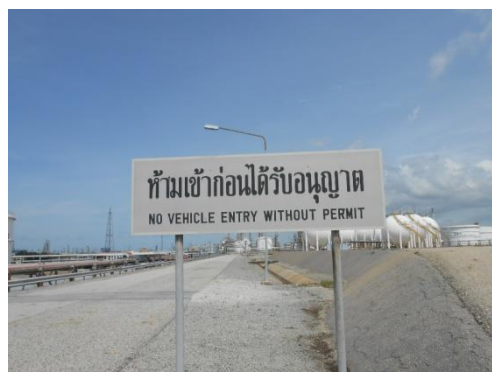
รูปที่ 3-39 ป้ายแสดงเขตพื้นที่หวงห้าม