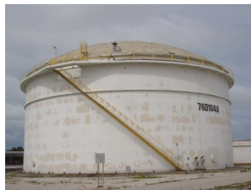
บ่อปรับสภาพน้ำเสียก่อนเข้าหน่วยเติมอากาศ (Equalization Tank)