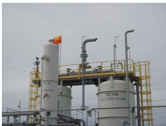
รูปที่ 3-20 Outlet ของ VRU