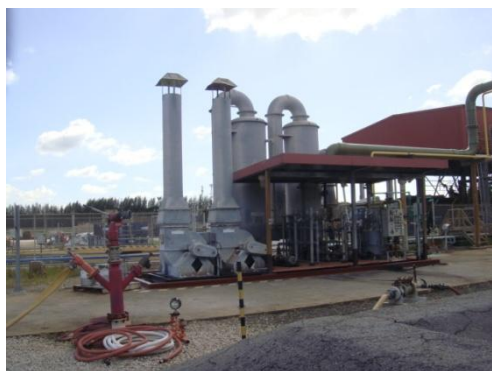
รูปที่ 3-15 Caustic Scrubber