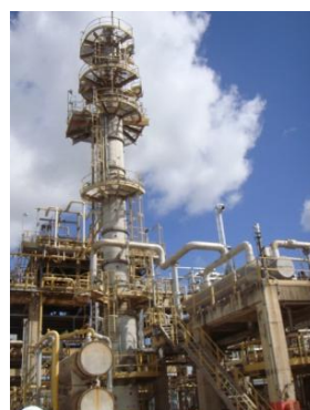
รูปที่ 3-6 Tail Gas Treatment Unit