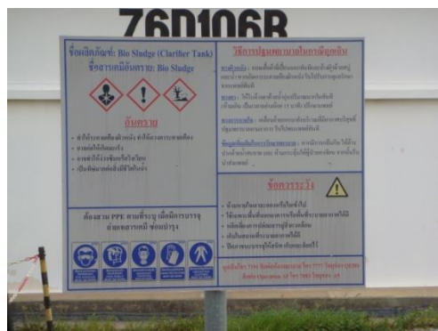
รูปที่ 3-34 ป้ายแสดงข้อมูลความปลอดภัย ของสารเคมี