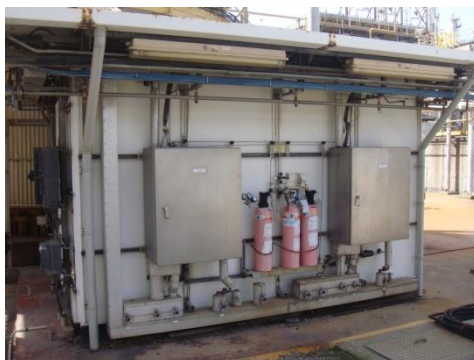
รูปที่ 3-9 CEMS ของปล่อง Tail Gas Treatment Unit