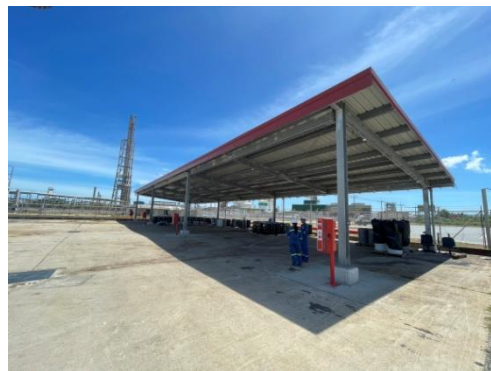
รูปที่ 3-24 พื้นที่พักกากของเสีย