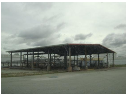
หน่วยบำบัดรวบรวมกากจุลินทรีย์ (Bio-Sludge Digester)