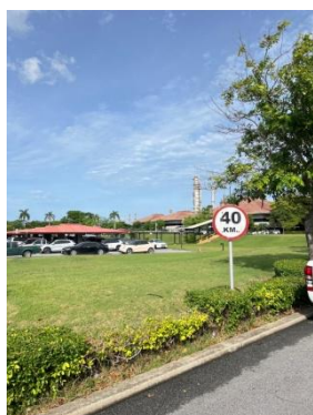
รูปที่ 3-29 ป้ายจำกัดความเร็ว บริเวณอาคารสำนักงาน