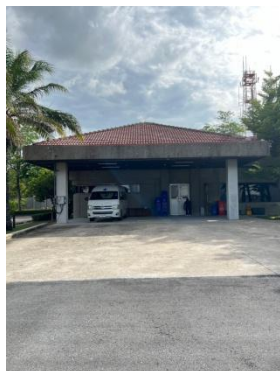
รูปที่ 3-33 รถพยาบาล