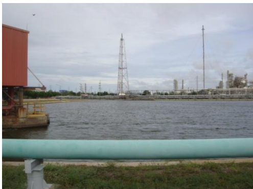
รูปที่ 3-23 บ่อน้ำดับเพลิง