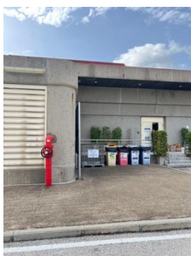
รูปที่ 3-25 ภาชนะบรรจุกากของเสียแยกประเภท