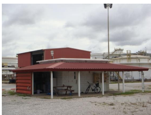
รูปที่ 3-40 ห้องปรับอากาศ