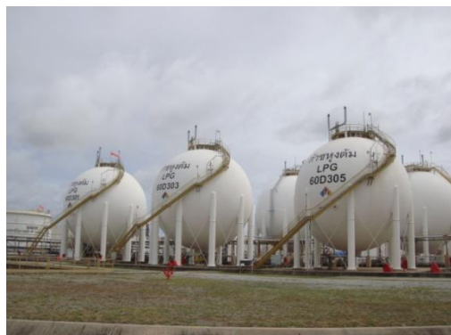
รูปที่ 3-51 ถัง LPG