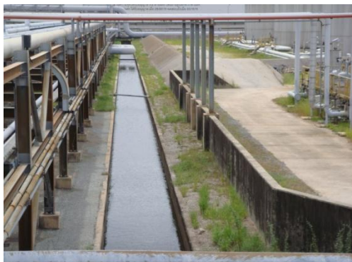
รูปที่ 3-27 รางระบายน้ำฝนแบบเปิด