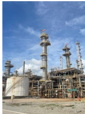
รูปที่ 3-4 Sour Water Stripping Unit