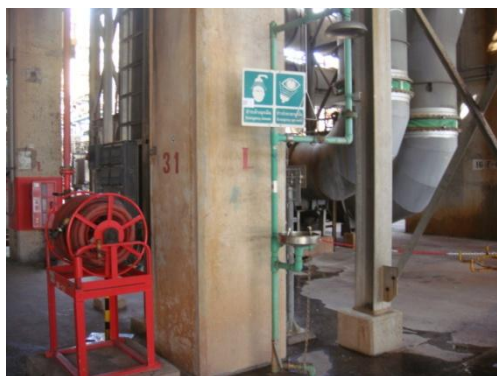
รูปที่ 3-35 ฝักบัวและอ่างล้างตาฉุกเฉิน