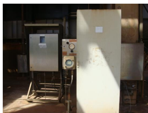
รูปที่ 3-8 CEMS ของปล่อง RFCCU

ภาพถ่ายประกอบการปฏิบัติตามมาตรการป้องกันและแก้ไขผลกระทบสิ่งแวดล้อม