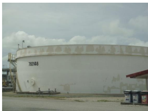
บ่อเติมอากาศ (Bioreactor Tank)