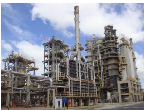
รูปที่ 3-5 HVGO Hydrotreating Unit