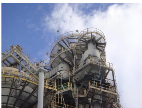
รูปที่ 3-11 Cyclone ที่ RFCCU