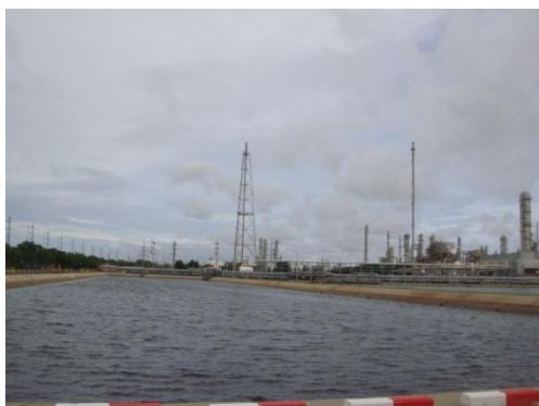
บ่อพักน้ำเสียที่ผ่านการบำบัดแล้ว (Polishing Pond)