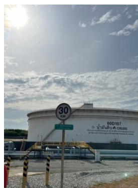
รูปที่ 3-30 ป้ายจำกัดความเร็ว บริเวณกระบวนการผลิต