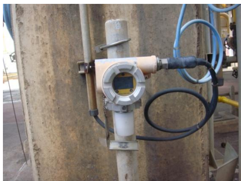
รูปที่ 3-42 Gas Detector