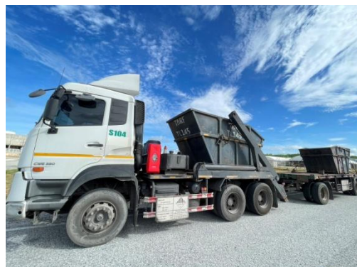
รูปที่ 3-52 การติดหมายเลขโทรศัพท์ที่รถขนส่ง