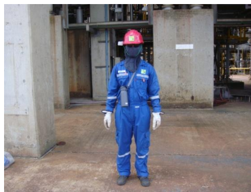
รูปที่ 3-36 พนักงานสวมใส่อุปกรณ์คุ้มครอง ความปลอดภัยส่วนบุคคล